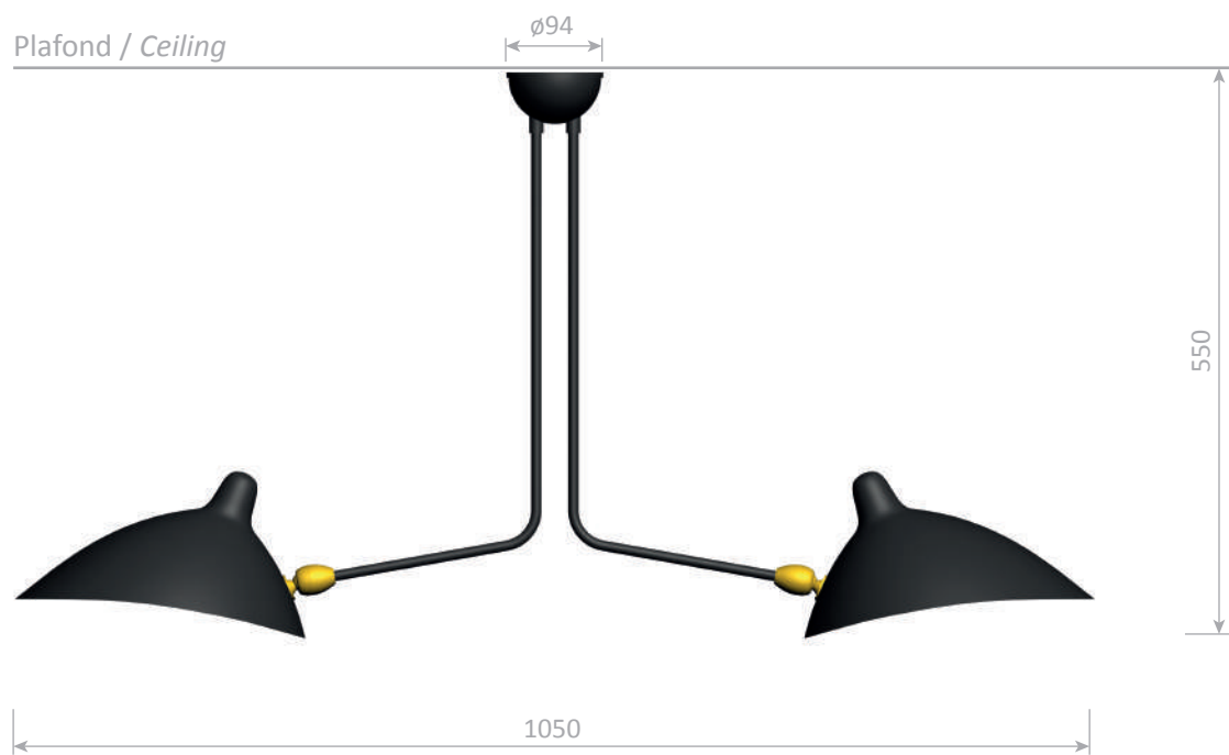
Plafonnier 2 bras fixes - 1959 2 fixed arm ceiling lamp - 1959