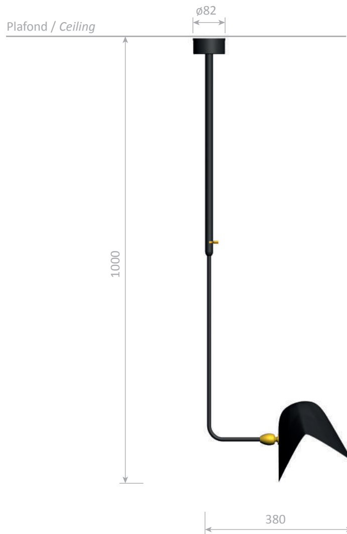
Plafonnier Bibliothèque courbe - 1953 Curved «Bibliothèque» wall lamp - 1953