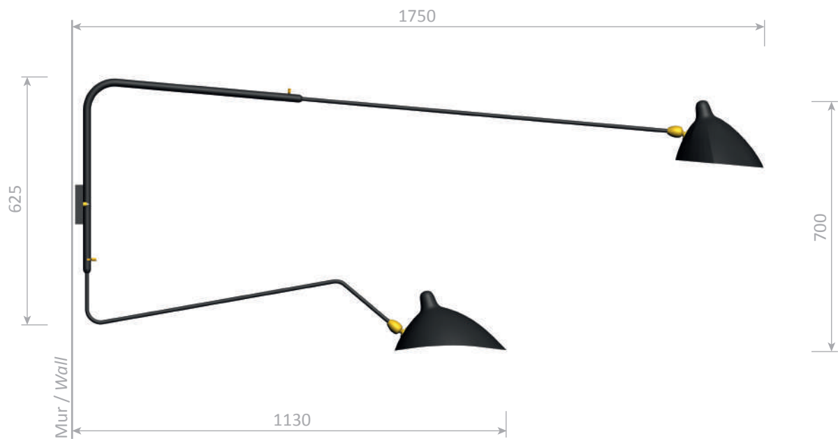
Applique 2 bras pivotants dont 1 courbe - 1954

Wall lamp with two rotating arms, 1 straight and 1 curved - 1954